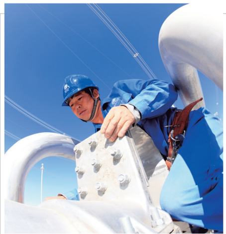
宣传政策 指导工作 交流经验 探讨理论 沟通信息